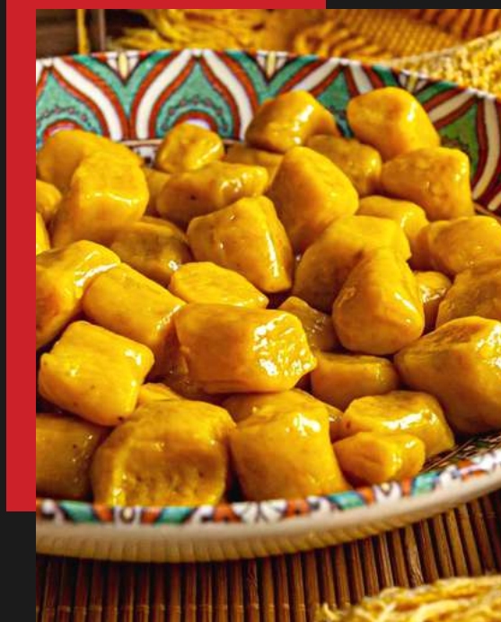
Gnocchi de abóbora