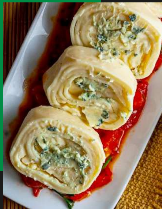
Rondelli quatro queijos