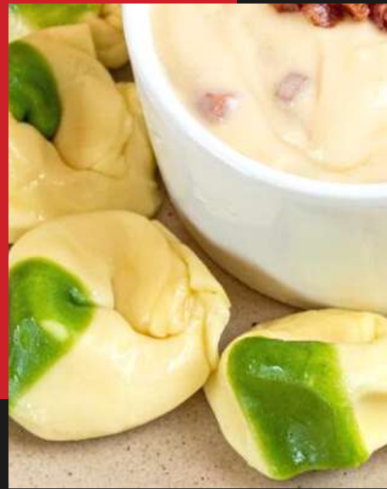
Agnolotti de alho poró