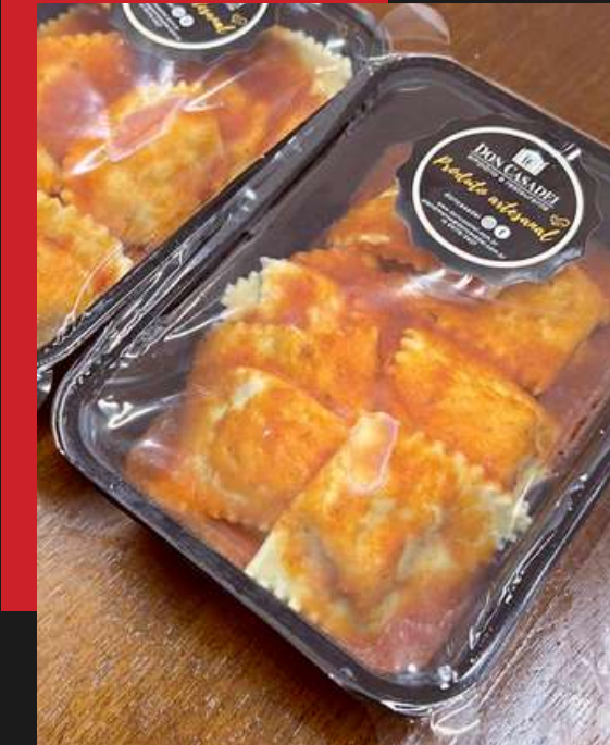
Ravioli de queijo meia cura com limão siciliano ao sugo