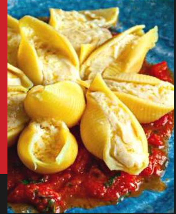
Conchiglioni de quatro queijos