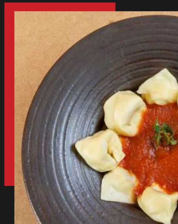
Cappelletti de frango