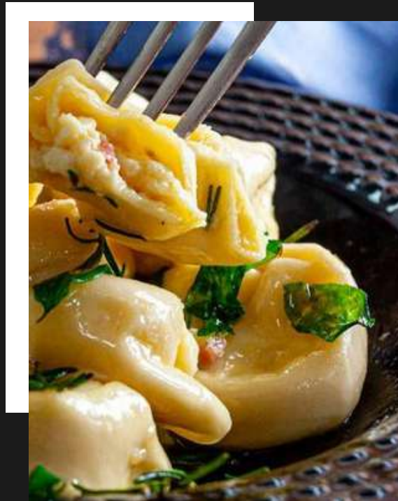
Tortelli de queijo brie e parma