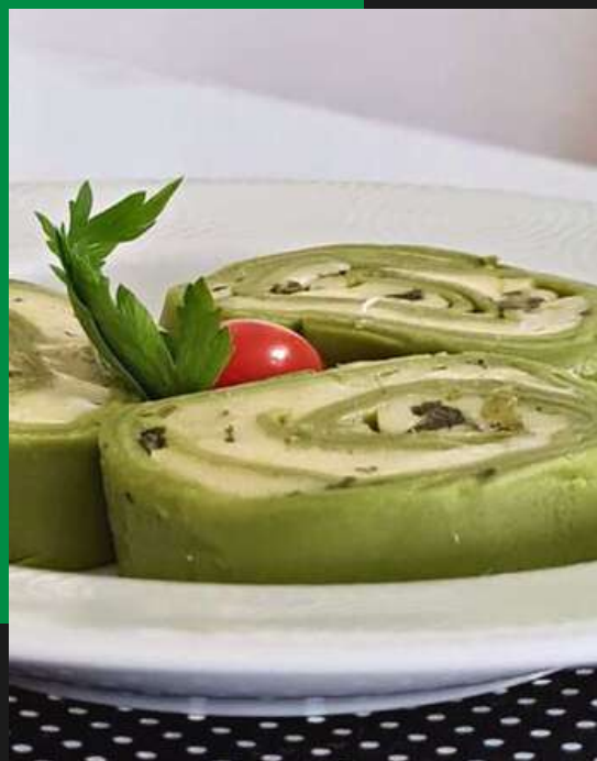
Rondelli verde de mussarela e manjericão