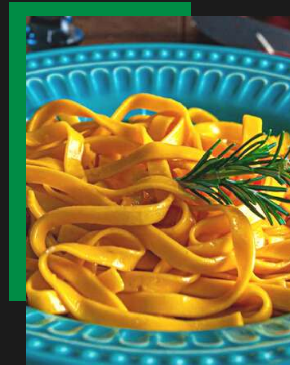
Talharim de abóbora