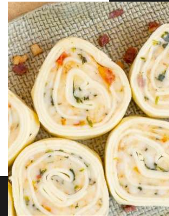
Rondelli tomate seco e rúcula