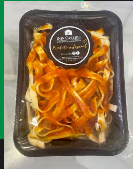
Talharim ao sugo