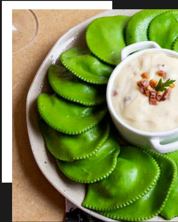
Mezzaluna de mussarela e manjericão