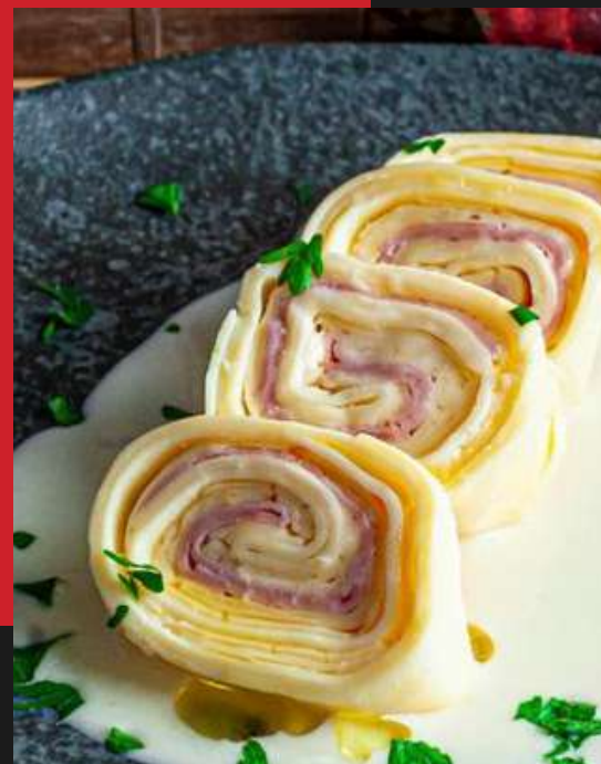
Rondelli presunto e queijo