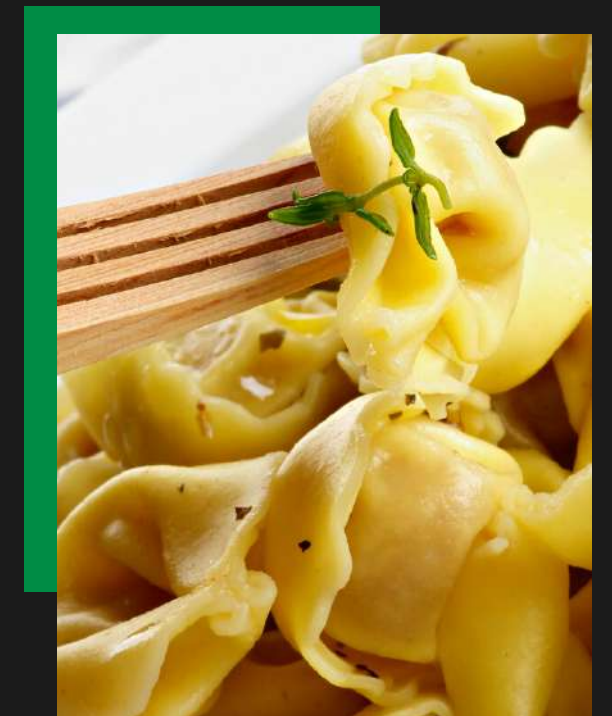
Cappelletti de queijo