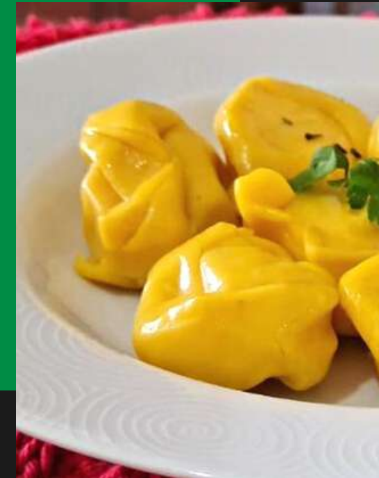
Tortelli de abóbora e parmesão