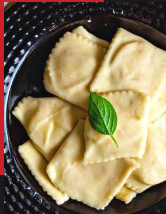
Ravioli de carne