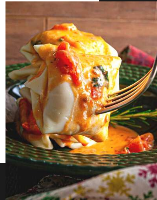
Manicaretti quatro queijos