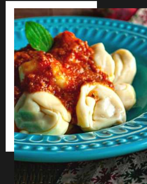
Cappelletti de carne