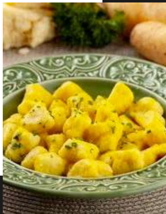
Gnocchi de mandioquinha