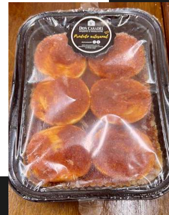
Rondelli quatro queijos ao sugo