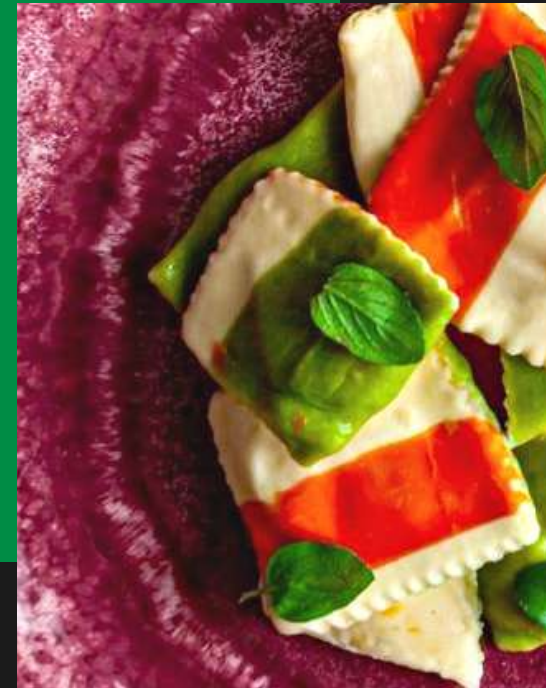
Ravioli de brie e damasco