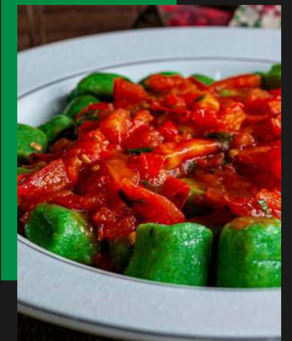
Gnocchi de espinafre