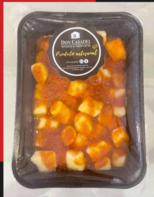
Gnocchi de batata ao sugo