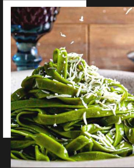
Talharim de espinafre