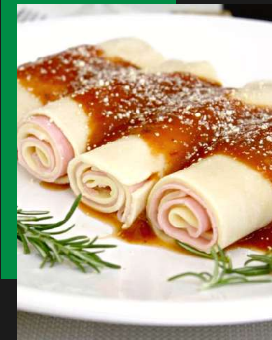
Cannelloni de presunto e queijo