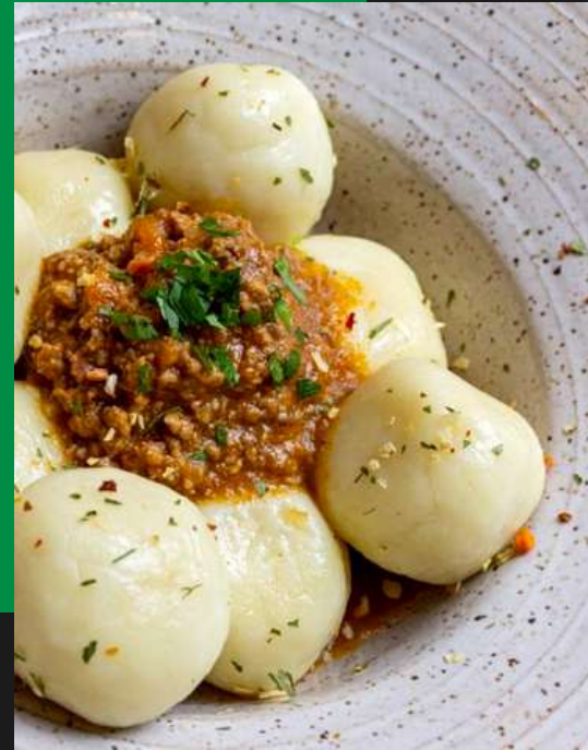
Gnocchi recheado de mussarela