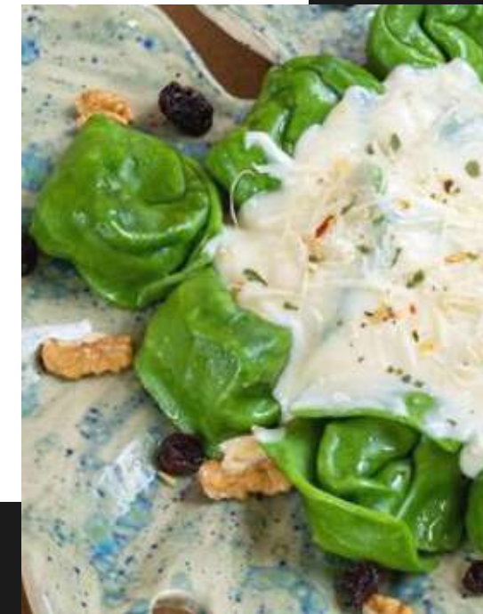
Tortelloni de ricota, nozes e uva passa