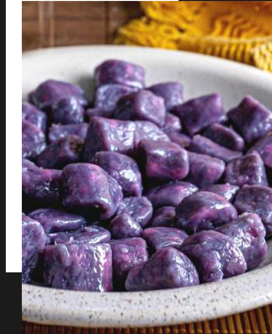
Gnocchi de batata roxa