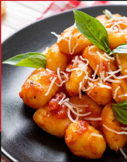
Gnocchi tradicional de batata