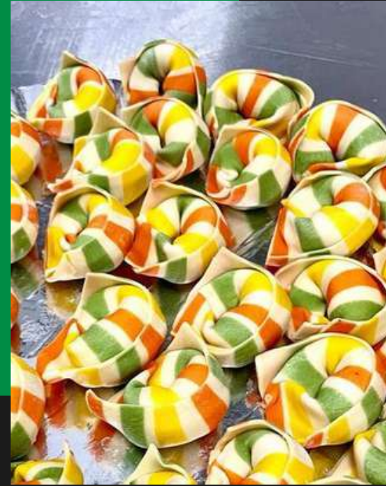
Macchiato mozzarella de búfala