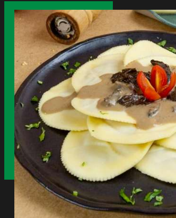
Mezzaluna de abóbora com carne seca