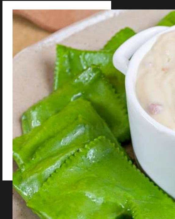
Ravioli verde de mussarela