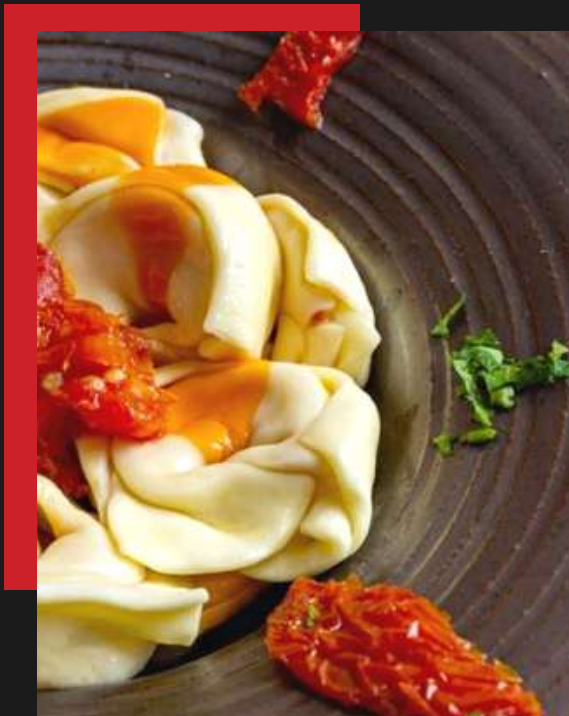
Tortelli muçarela com tomate seco